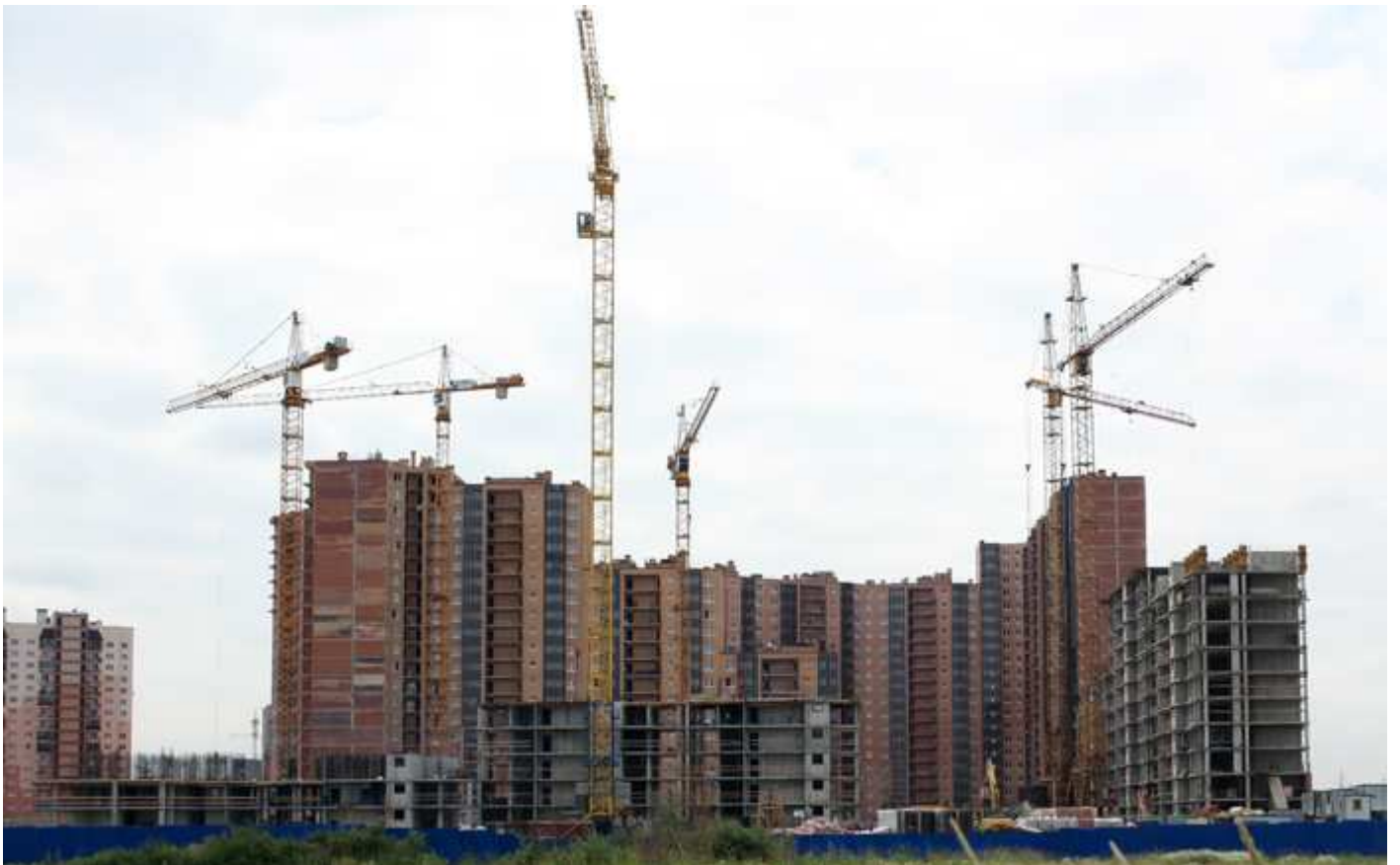
Секции 27, 26, 15-17