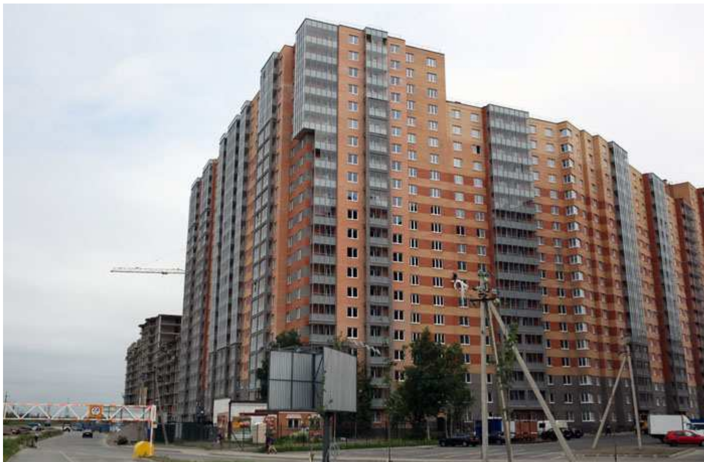
Вид с Областной улицы на секции с 14 по 6 (слева направо)