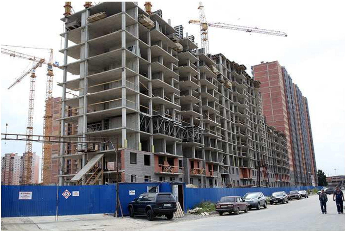
Вид с улицы Областной на секции 17-15