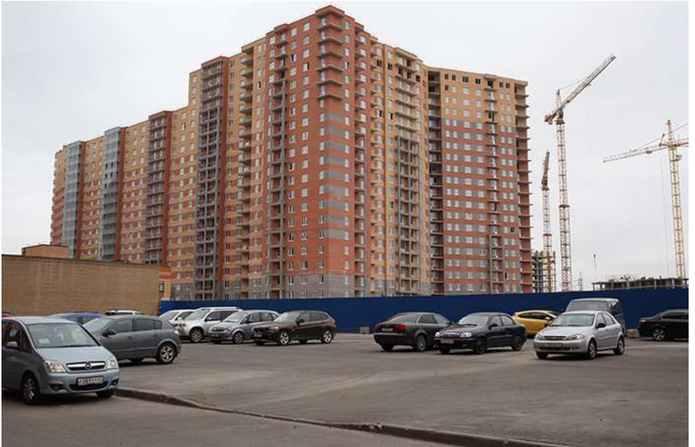
Вид на секции 10-6 (6 - угловая), 5-4