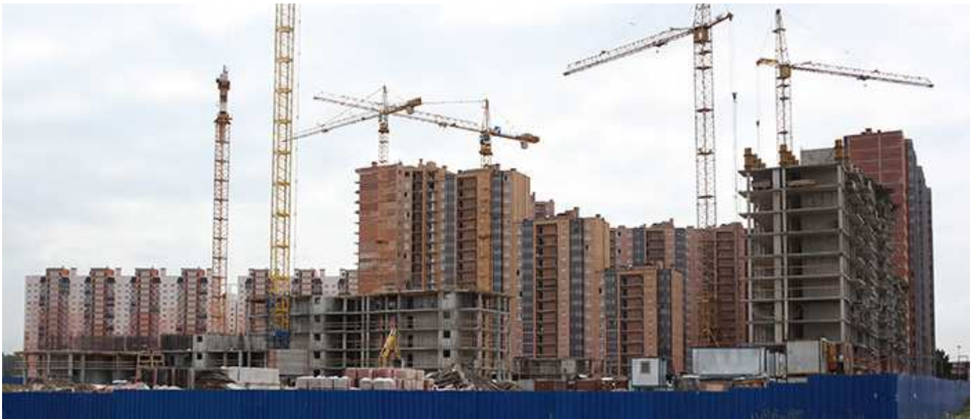
Секции 27, 26, 31, 17